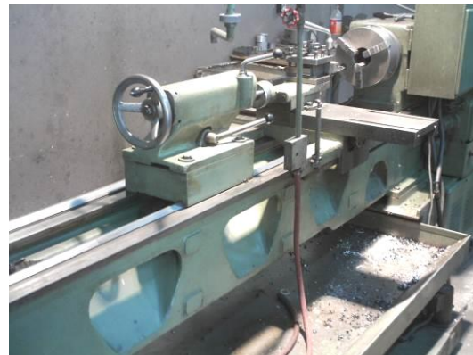
شکل ۱: دستگاه تراش