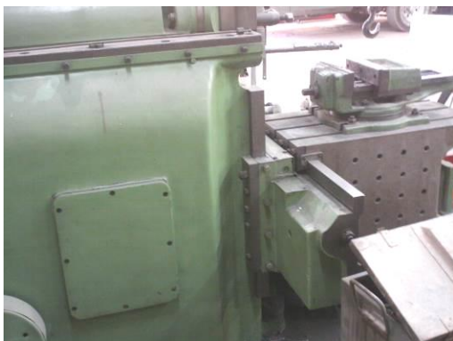
شکل ۶: دستگاه صفحه تراش