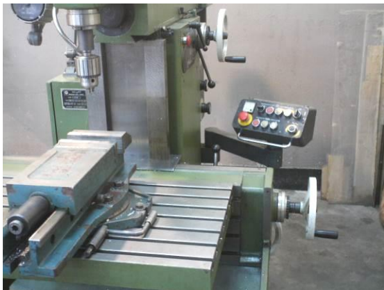
شکل ۲: دستگاه فرز