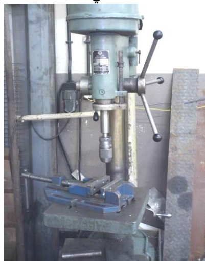
شکل ۵: دستگاه دریل