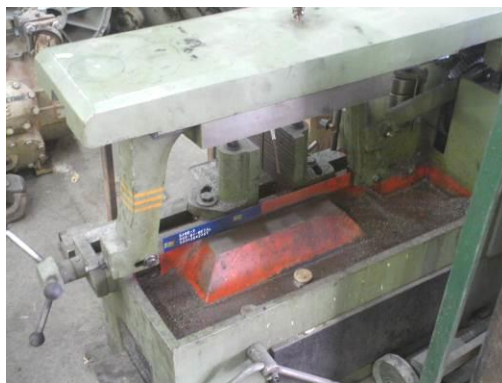
شکل ۷: دستگاه اره لنگ