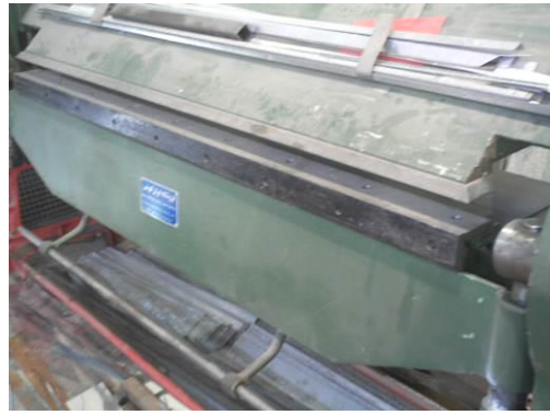
شکل ۹: دستگاه خم