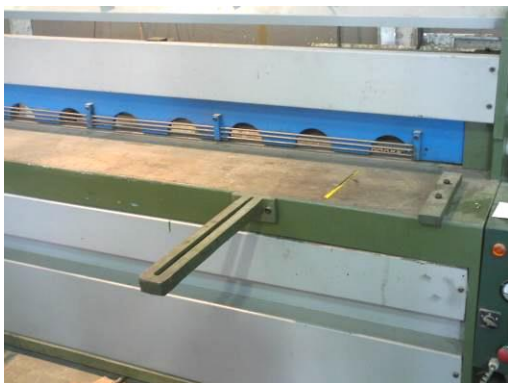
شکل ۸: دستگاه گیوتین