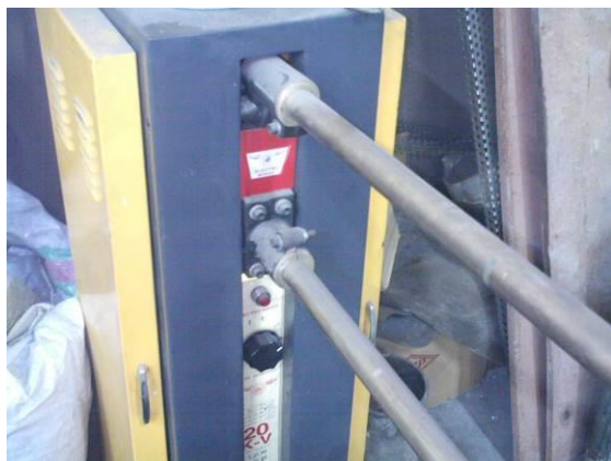
شکل ۴: دستگاه جوش نقطه ای