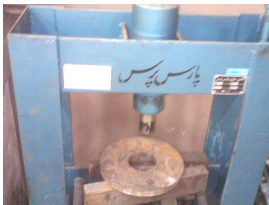
شکل ۳: دستگاه پرس هیدرولیکی ۱۵ تنی